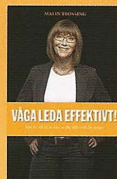
VÅGA LEDA EFFEKTIVT!

Har du modet att bli en effektiv ledare? Är det svårt att få tiden på jobbet att räcka till? Känner du att dina medarbetare har mer att ge? Det finns många ledare som sitter i samma sits. Boken ger konkreta tips på hur man kan gå tillväga för att bli effektivare i sitt ledarskap och jobba smartare, inte snabbare. Den tar ledarens stressiga tillvaro på allvar. Det gäller att fokusera på rätt saker och att göra dem rätt. »Våga leda effektivt!« nominerades till Årets ledarskapsbok 2010 av tidningen Personal & Ledarskap.