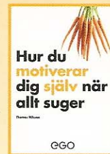
Hur du motiverar dig själv när allt suger